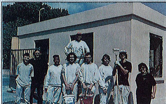
► Chantier peinture au club-house pour les uns et nettoyage de l'école pour les autres. Les jeunes de l'IME poursuivent leur insertion.